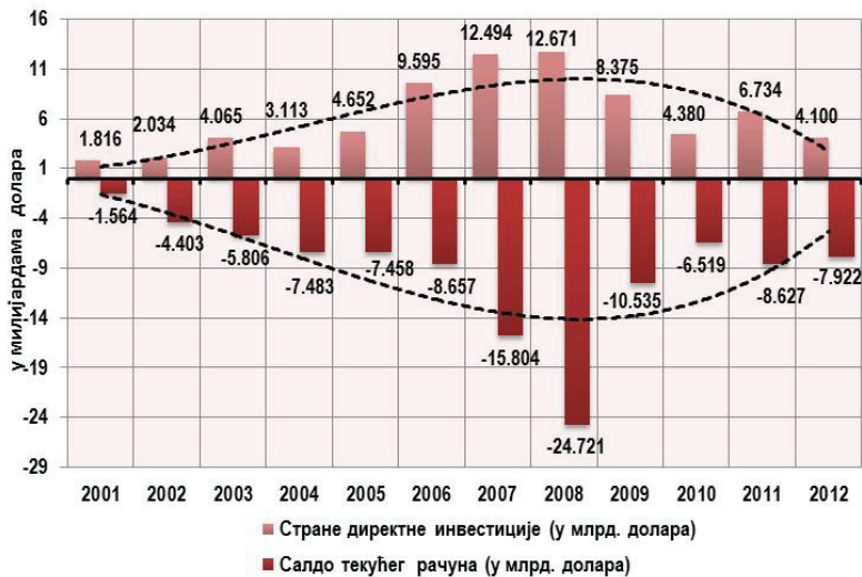
Слика 4: Стране директне инвестиције и салдо текућег рачуна (укупно за Западни Балкан)

Будући да је величина прилива страних директних инвестиција у овом раду преваходно третирана као извор финансирања привредног развоја долази се до закључка да су екстерни извори финансирања привредног развоја земаља Западног Балкана имали крајње проциклични карактер. Наиме, из података се види да су они расли у годинама просперитета, а да су драматично опадали у годинама економске кризе глобалног карактера. Најкраће, криза је негативно деловала на прилив страних директних инвестиција у земљама Западног Балкана. Ово важи и поред уважавања става да су на овакав тренд одређени утицај имале околности повезане са практично завршеном приватизацијом државних предузећа у њима. Додатни проблем сагледаваних привреда Западног Балкана је што не повезују неопходну домаћу штедњу и то што су се средства стечена по основу приватизације највећим делом слила у потрошњу. У сваком случају неспорно је да стране инвестиције иду на тржишта која су потенцијално стабилна и која су највише одмакла