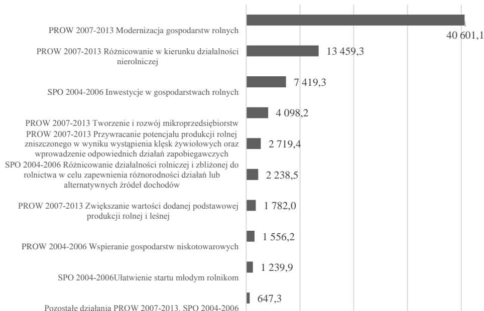
Rys. 1. Wartość projektów inwestycyjnych zrealizowanych w latach 2004-2015 przez badane gospodarstwa rolne (w tys. zł) według działań realizowanych w ramach WPR

Łączna wartość tych nakładów wyniosła nieco ponad 54 mln zł, co stanowiło ponad 71% wartości wszystkich badanych projektów.