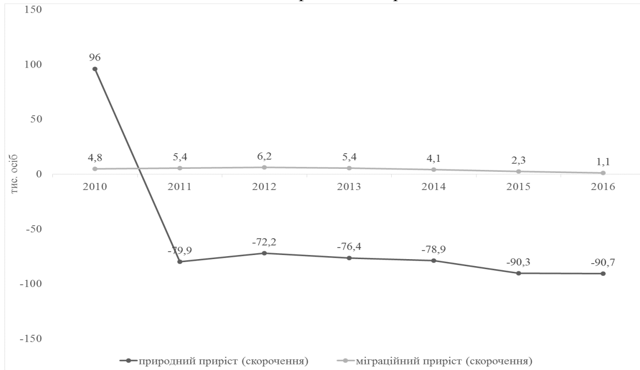
Рис. 1. Динаміка міграційного та природного руху сільського населення України, 2010–2016 рр.

Результатом дослідження міграційного приросту (скорочення) сільського населення за допомогою логарифмічної моделі є виробнича функція Y = -1721,74LN(X) + 6324,87 та коефіцієнт детермінації R^2 = 0,41 .