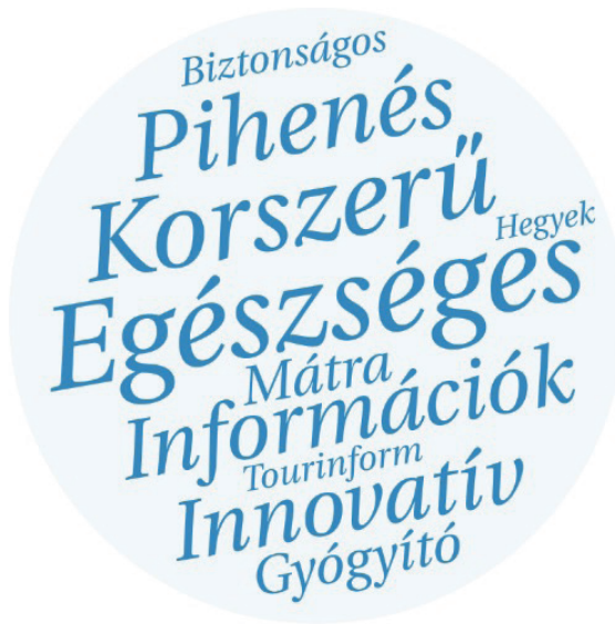
2. ábra. Egészségturisták által megalkotott szófelhő

A kérdőívek elemzése során összegyűjtésre kerültek a turizmustervezés folyamatában szerepet játszó fogalmak. A kérdőívet kitöltők a szófelhőben kiemelt szavakkal jellemezték az egészségturizmusban számukra legfontosabb elvárásokat. A 10 leggyakoribb elvárás jelentős része a korszerűség, innováció, információ kombináció volt, ami fontos mondanivalót képvisel az iparág számára. Az egészségturisták több és jobban elérhető információt szeretnének kapni a mai igényeknek megfelelő korszerű módon.