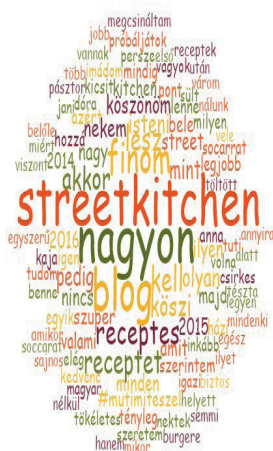
1. ábra: A Street Kitchen közösségi oldalának a szófelhője

rakterből álló szó előfordulási számát vettem figyelembe a posztokon és azok kommentjein belül. Mivel a program magyar nyelvű szövegeket nem ismer fel, ezért manuálisan ki kellett szűrni az agglutináció miatti szóismétléseket, valamint az olyan kötőszavakat, melyek jelentős része a szövegben nem rendelkezett releváns tartalommal. (pl. vagy, hogy, http stb.)