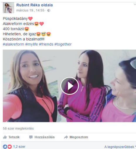
4. ábra: Az emotikonok jelentősége a szerző posztjaiban

A sportoló oldalán rengetek érzelmre utaló emotikon található, szívek, szívet küldő fejek és egyéb szeretetet megtestesítő figurák uralják a bejegyzéseket, mind a blogger, mind a követők részéről. Az alábbi poszton mindössze 10 szó van, de 7 db emotikont kapcsolt hozzá a szerző: