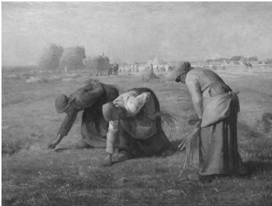
FIGURA 1 – The Gleaners, 1857, por Jean-François Millet (1814-1875)

As entrevistadas analisam a imigração, visto que a maioria dos trabalhadores (homens e mulheres) é de outros estados, justificando que mulheres e homens da cidade não têm capacidade (disposição) para realizar o trabalho nos