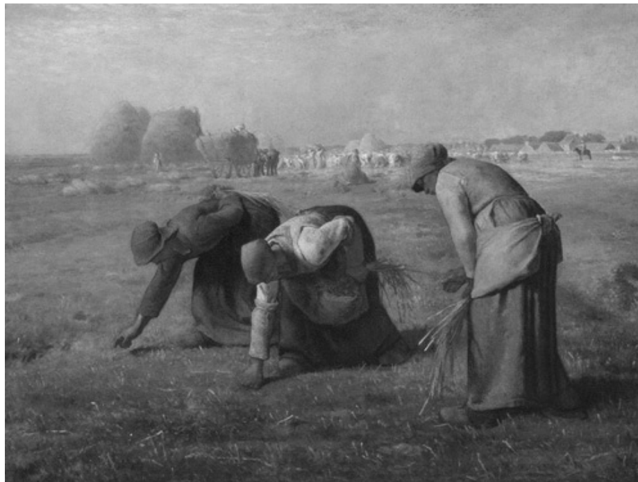
FIGURA 1 – The Gleaners, 1857, por Jean-François Millet (1814-1875)

As entrevistadas analisam a imigração, visto que a maioria dos trabalhadores (homens e mulheres) é de outros estados, justificando que mulheres e homens da cidade não têm capacidade (disposição) para realizar o trabalho nos