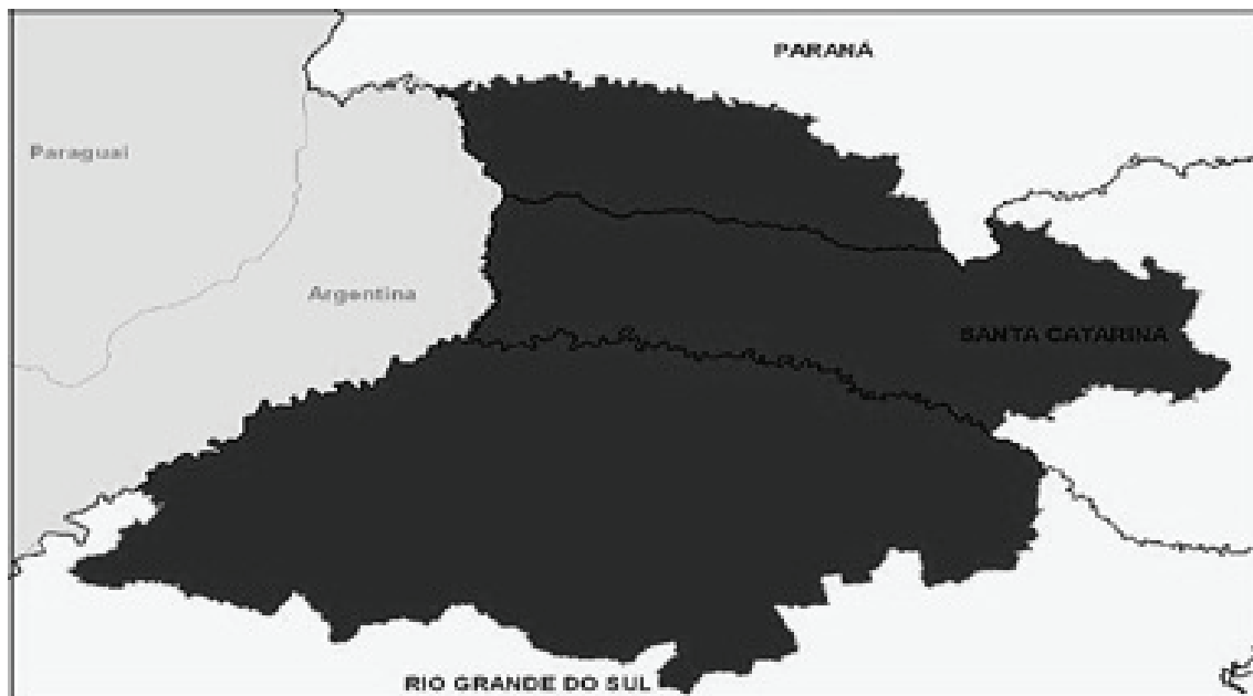
FIGURA 2 – A Mesorregião Diferenciada MESOMERCOSUL