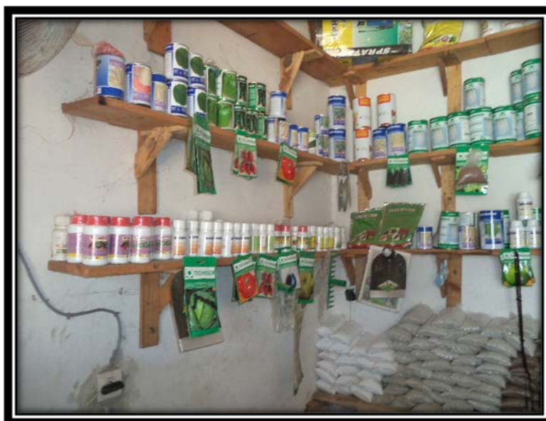
Magasin de stockage de pesticides

Dans le domaine du contrôle, les vendeurs de pesticides sont régulièrement contrôlé (3 fois/an en moyenne) par les services de la DPV notamment sur l'autorisation d'exercer, la date de péremption, les normes techniques, l'emballage, l'environnement de stockage). Pour pallier le problème de trafics illicites et l'insuffisance d'inspecteurs, la DPV forme les responsables aux frontières (douaniers, contrôleurs au port) dans le domaine des pesticides. De plus, la DPV appuie la structuration et l'organisation d'une interprofession à travers des sessions de formation et des émissions sur les radios communautaires. Pour beaucoup de producteurs et de vendeurs, la forte concentration de matières actives dans le pesticide est synonyme d'efficacité du produit. L'interprofession pourrait jouer un rôle d'éveil des consciences sur le danger que peut représenter les pesticides.