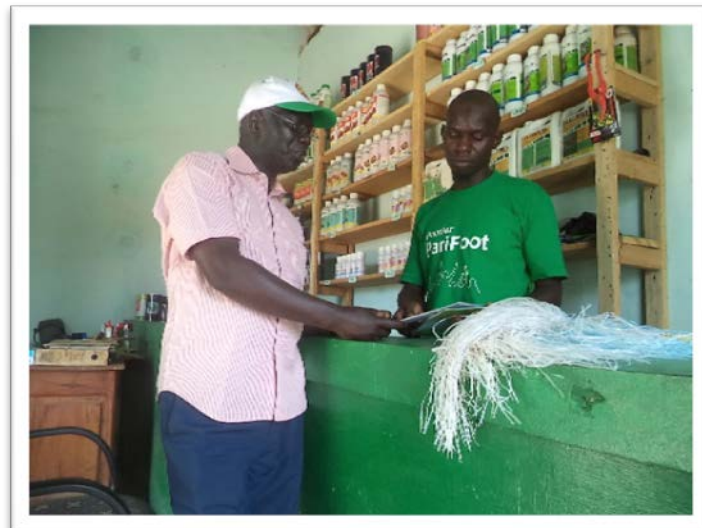
Remise de document d'information à 2 vendeurs de pesticides : Source DPV Suivi des pesticides 2015