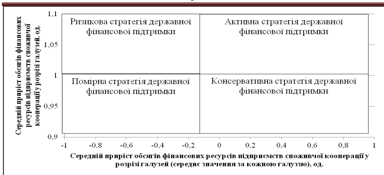
Рис. 3. Матриця конкурентного позиціонування стратегій державної фінансової підтримки розвитку споживчої кооперації за видами економічної діяльності