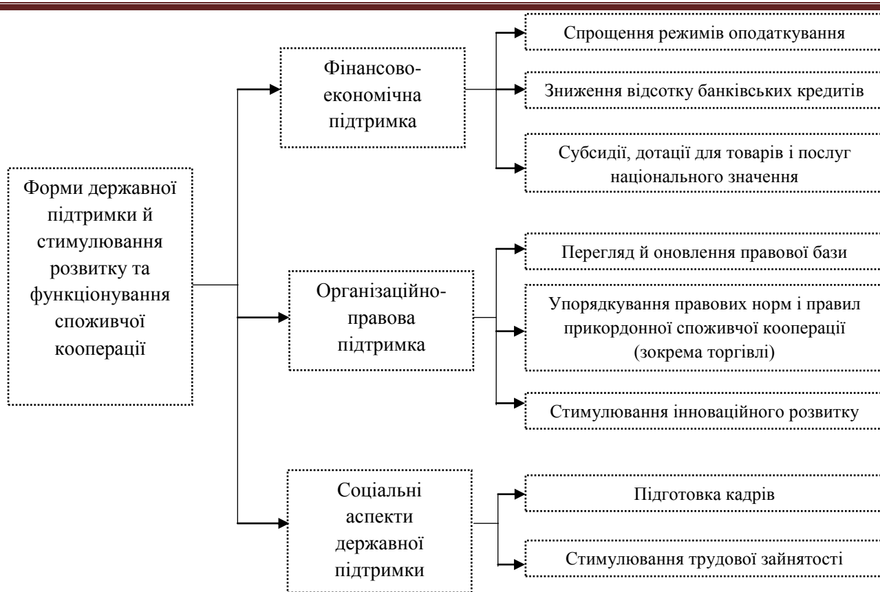
Рис. 2. Основні напрями державної підтримки розвитку споживчої кооперації України