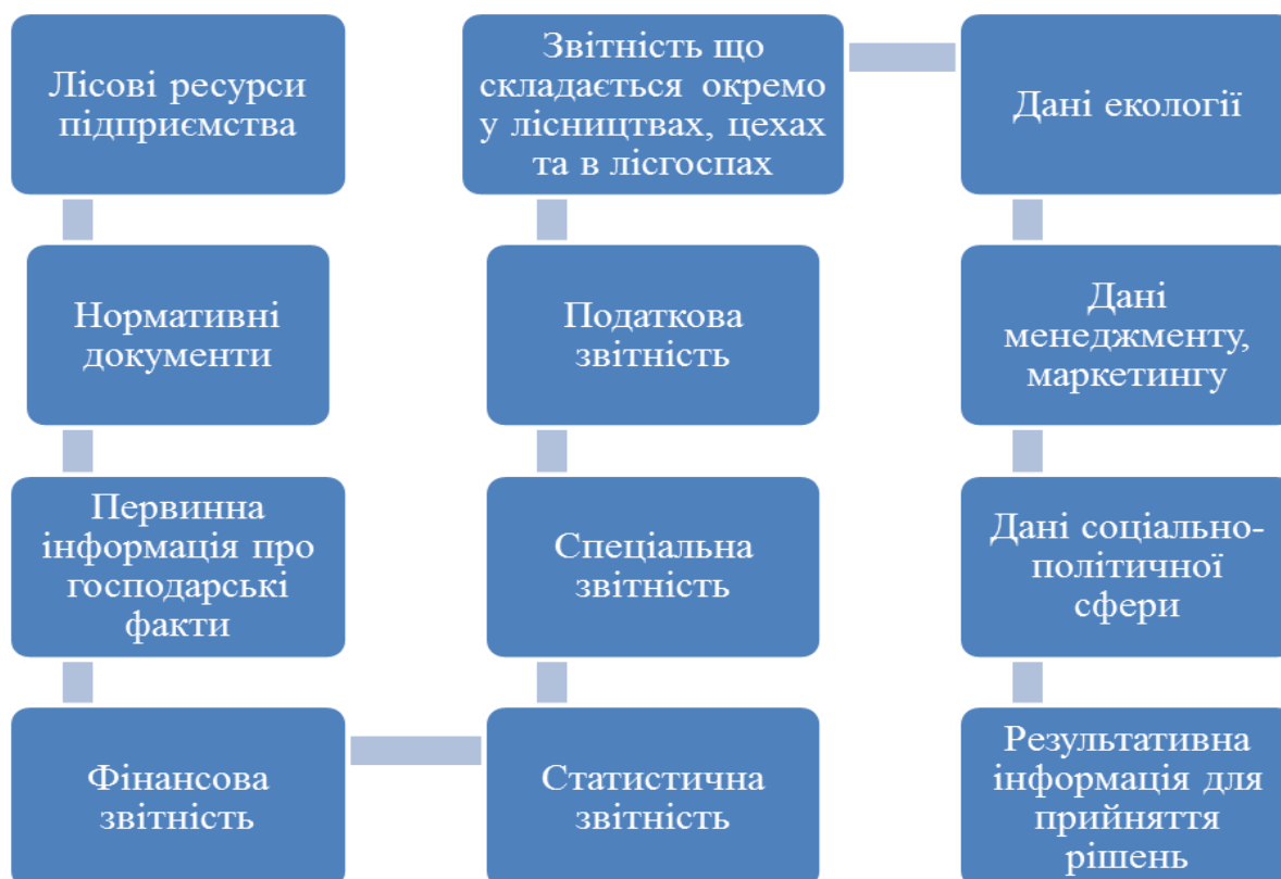
Рис. 1. Взаємозв'язок даних для формування системи обліково-аналітичного забезпечення