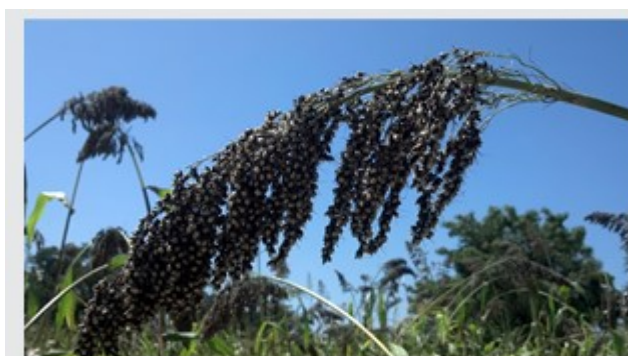
L'hybride de sorgho "Pablo" dans une parcelle près de Dioila.

Jusqu'à-là, les données provenant des essais participatifs en champs des producteurs montrent d'importantes hausses des rendements associées aux hybrides de sorgho de race guinéenne dans diverses conditions—notamment avec ou sans engrais (Rattunde et al. 2013).