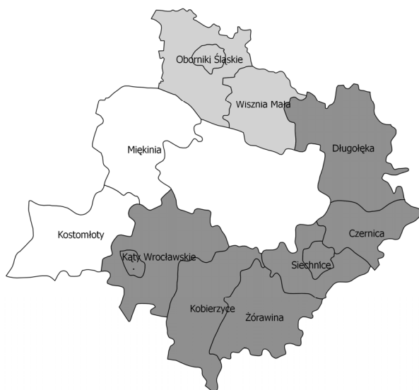
Rys. 1. Przynależność administracyjna obszaru opracowania

wiązać także z innym modelem życia mającym swoje odzwierciedlenie w przyroście naturalnym. W literaturze przedmiotu ten czynnik nie jest jednak uznany za rzucający na zmianę zaludnienia obszarów podmiejskich. Stąd też zmiany liczby ludności częścię przypisuje się procesom migracyjnym. Obszarem badań są powiaty wrocławskie gminy podlegające procesowi suburbanizacji ze szczególnym uwzględnieniem nowej zabudowy mieszkaniowej. W zestawieniu ujęto osiem samorządów przylegających bezpośrednio do Wrocławia oraz dwa leżące w stosunkowo niewielkiej odległości od granic administracyjnych miasta centralnego. Wybrane gminy administracyjnie należą do trzech powiatów: średzkiego (Kostomłoty i Miękinia), trzebnickiego (Oborniki Śląskie i Wisznia Mała) oraz wrocławskiego (Długołęka, Czernica, Siechnice, Zórawina, Kobierzyce i Kąty Wrocławskie), zaprezentowanych poniżej (rys. 1).