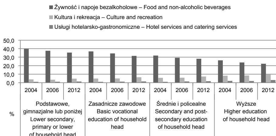
Rys. 3. Udziały wydatków na dobra podstawowe i wyższego rzędu w latach 2004, 2006 i 2012 w zależności od wykształcenia głowy gospodarstwa domowego