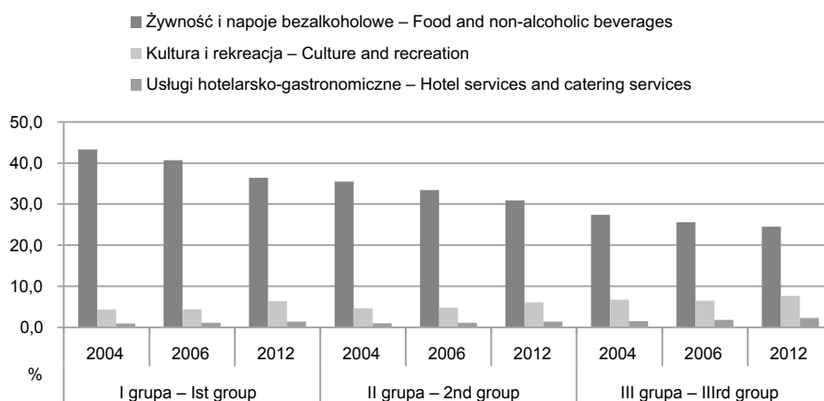
Rys. 2. Udziały wydatków na dobra podstawowe i wyższego rzędu w latach 2004, 2006 i 2012 w zależności od grupy dochodowej gospodarstwa domowego