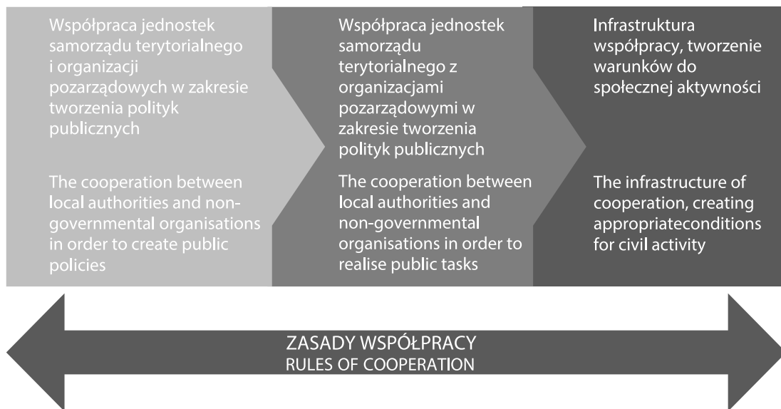
Figure 2. A model of the three areas of cooperation between local authorities and non-governmental organizations Rysunek. 2 Trzy płaszczyzny współpracy JST i organizacji pozarządowych – ujęcie modelowe

Sam, natomiast wypełnianie go treścią powinno być zależne od regionalnego lub lokalnego kontekstu. Model jest więc w zamierzeniu zbiorem określonych narzędzi, które zgodnie z potrzebami i możliwościami mogą być wykorzystane przez każdy polski samorząd. Oznacza to, że pozostaje on uniwersalny, a każdy samorząd może wykorzystać odpowiednie narzędzia zawarte w modelu zgodnie ze swoimi potrzebami i możliwościami. Trzeba jednak podkreślić, że w modelu nacisk kładziony jest przede wszystkim na kulturę współpracy, rozumianą jako zjawisko daleko wykraczające poza zapisy prawa. Część zawartych w nim zadań, np. partnerstwa lokalne, nie wynika bowiem z regulacji prawnych, lecz właśnie z kultury współpracy. Ponadto w samych przepisach prawa część rozwiązań jest obligatoryjnych (np. roczne programy współpracy), a część fakultatywnych (np. rady działalności pożytku publicznego czy wieloletnie programy współpracy). O zastosowaniu konkretnych rozwiązań (poza obowiązkowymi) powinni zdecydować partnerzy, kierując się kryterium ich przydatności. W modelu zaleca się oparcie współpracy na trzech płaszczyznach (Rysunek 2).