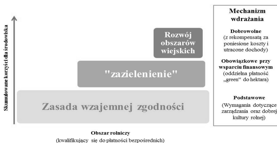
Rys. 2. Struktura nowej "zazielenionej" WPR

finansowa. Państwo stosuje zatem instrumenty ekonomiczne w postaci dotacji za dostarczanie dóbr publicznych oraz w postaci podatków i opłat za niewłaściwą postawę wobec środowiska. Otrzymywana dotacja za dostarczanie dóbr publicznych ma za zadanie rekompensować część kosztów związanych z koniecznością rezygnacji z większego zysku. Na tej podstawie od 2015 r. wprowadzono nowy obowiązkowy mechanizm – tzw. zazielenioną płatność bezpośrednią (I filar). Na tę płatność przeznaczono aż 30% koperty krajowej. Jest to płatność z tytułu realizacji praktyk rolniczych korzystnych dla klimatu i środowiska, którą można uzyskać po spełnieniu określonych wymagań dotyczących dywersyfikacji upraw rolnych, utrzymania TUZ oraz dzięki przeznaczaniu części powierzchni na cele proekologiczne.