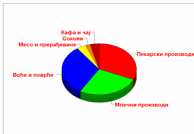
Слика: 1. Структура продаје производа органске пољопривреде у ЕУ Figure: 1. Structure of organic agriculture products sale in EU