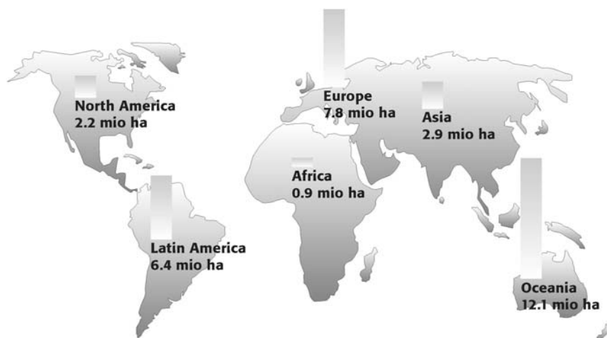
Слика 1. Површине земљишта за органску пољопривреду по регионима 2007. Picture 1. Land surface for organic production, by regions 2007. (Willer, 2009)

Укупне органске области у Азији је око 2,9 милиона хектара и 230.000 произвођача, у Европи 7, 800.000 ха и 200.000 фарми, у Латинској Америци 6,400.000 ха и 220.000 произвођача, у Океанији 7.222 произвођача управља са 12,100.000 ха (Willer, 2009).