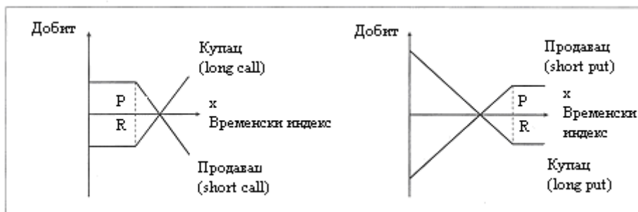
Шема 1: Структура наплате код куповне и продајне опције

временске прилике. У случају да је остварени индекс изнад граничног нивоа не долази до наплате.