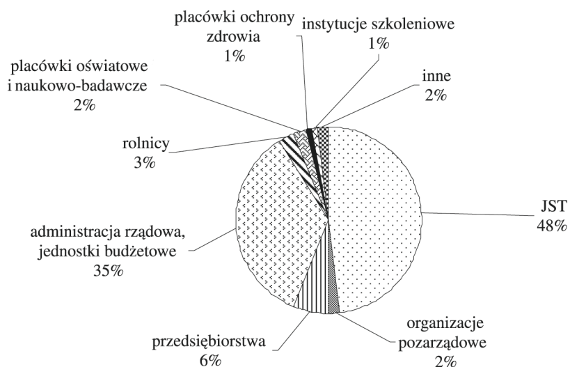
RYSUNEK 1. Struktura beneficjentów programów finansowanych z funduszy strukturalnych i Funduszu Spójności w latach 2004–2006 [Słomińska 2007]