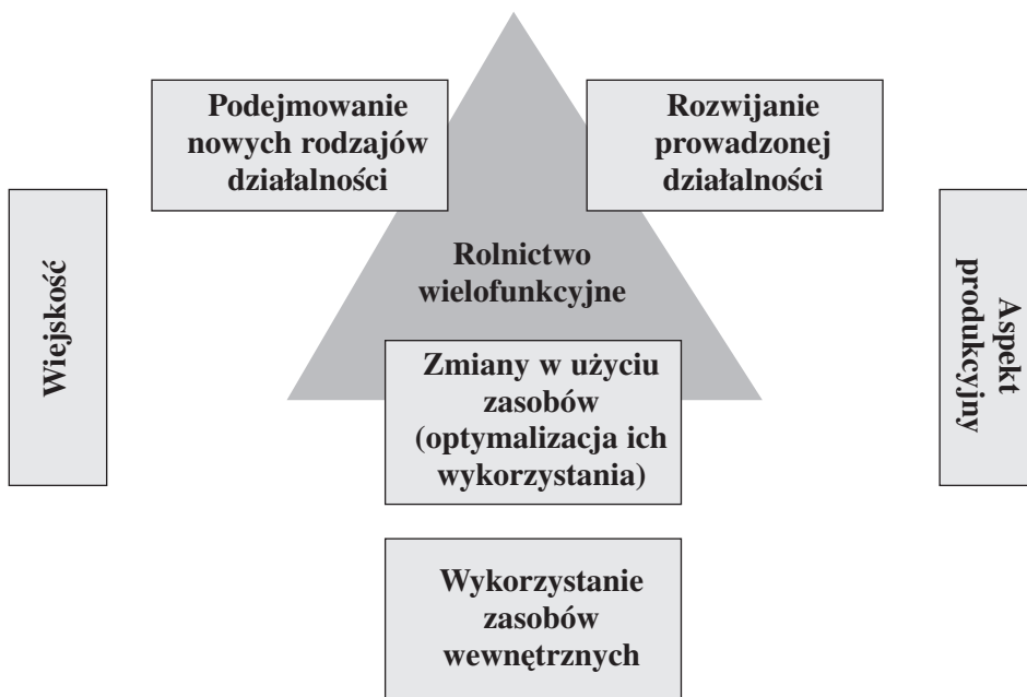
RYSUNEK 2. Zmiany w kierunku wielofunkcyjności zachodzące w gospodarstwie konwencjonalnym

Zmiany w tym przypadku mają swój początek w zamianie status quo gospodarstwa konwencjonalnego w wielofunkcyjne. Zmiana w kierunku wielofunkcyjności na poziomie gospodarstwa implikuje zmiany we wszystkich wymienionych aspektach (rysunek 2). Stosując zasadę wielofunkcyjności, rolnik może