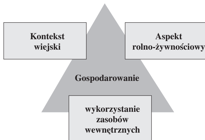
RYSUNEK 1. Trzy aspekty działalności gospodarstwa rolniczego

Rozważając wielofunkcyjność gospodarstw warto przywołać tzw. model van der Ploega [van der Ploeg i in. 2002, Belletti i in. 2002, van der Ploeg i Roep 2003]. W funkcjonowaniu każdego gospodarstwa wyróżnia on trzy aspekty (rysunek 1). Pierwszy to klasyczny, rolniczy aspekt, związany z produkcją dóbr żywnościowych oraz z wchodzeniem w sieci rolno-żywnościowe z innymi producentami oraz odbiorcami produktów (agricultural side / agri-food networks / agri-food supply chain. 4 Drugi to aspekt wiejski – „wiejskość” (rural context / rural side). Z jednej strony chodzi w nim o to, iż przedsiębiorstwo rolnicze funkcjonuje na obszarze wiejskim i poprzez gospodarowanie wnosi wkład w zachowanie i zmiany (również: degradację) krajobrazu wiejskiego i jego walorów.