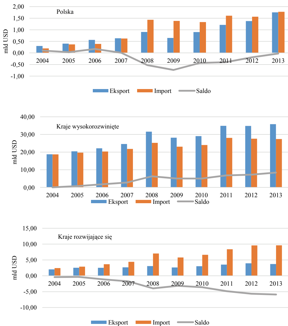
Rys. 2. Wartości eksportu i importu oraz bilans handlu wieprzowiną Polski i badanych grup państw o różnych poziomach rozwoju w latach 2004-2013