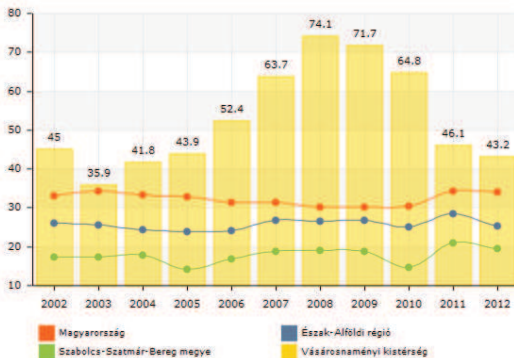
3. ábra: 1000 lakosra jutó összes kereskedelmi szálláshely szállásférőhelyeinek száma

A diagramról jól leolvasható, hogy a Vásárosnaményi kistérség 10 év elteltével megkétszerezte a térségbe látogató külföldi vendégek számát, amely véleményünk szerint szoros összefüggésbe hozható a Szatmári Szilvaút kompakt turisztikai programcsomag kialakításával. Látható, hogy a 2002-es 6,75 %-os arány 2012-re 12,39 %-ra nőtt. Ez a statisztikai számadat is alátámasztja azt a tényt, hogy növekszik a Vásárosnaményi kistérség települései iránt a turisztikai kereslet nem csak a hazai, hanem a külföldi vendégek körében is. Feltehetően ehhez a térség határ menti elhelyezkedése is hozzá járul. A turisztikai számadatok is mutatják, hogy egy több napos komplex turisztikai programcsomag kialakítását követően növekvő tendencia irányában mozdul a kereslet. Vizsgálataink statisztikai adatokat alapul vevő részét tovább folytatva, megvizsgáljuk az 1000 lakosra jutó összes kereskedelmi szálláshely szállásférőhelyeinek számát, amely azt fejezi ki, hogy a népesség számához képest milyen turisztikai fogadóképességgel rendelkezik egy térség. Előzetes hipotéziseink alapján azt feltételeztük, hogy a turisztikai szolgáltatás portfóliójának bővítése óta a szálláshelyek száma is növekedett a térségben a vizsgált időperiódusban.