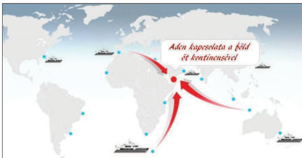
2. ábra: Áden kikötő földrajzi elhelyezkedése

A világon jelenleg több mint háromszáz (300) vámmentes illetve szabadkereskedelmi terület létezik. E területek tanulmányozása, elemzése, betöltött szerepe, földrajzi helye, forgalma, jellemzői alapját képezhetnék arra vonatkozóan, hogy hogyan, miként lehetne Ádent is térsége legfontosabb, sikeresen működő vámmentes területévé alakítani. A már meglévő és jól funkcionáló vámszabad területek eredményeit, esetleg kudarcait is, hasznosítani lehet, fel lehet használni az újonnan létrejövő, azonos feladatot betöltő vámszabad területen, így a jemeni Ádenben is.