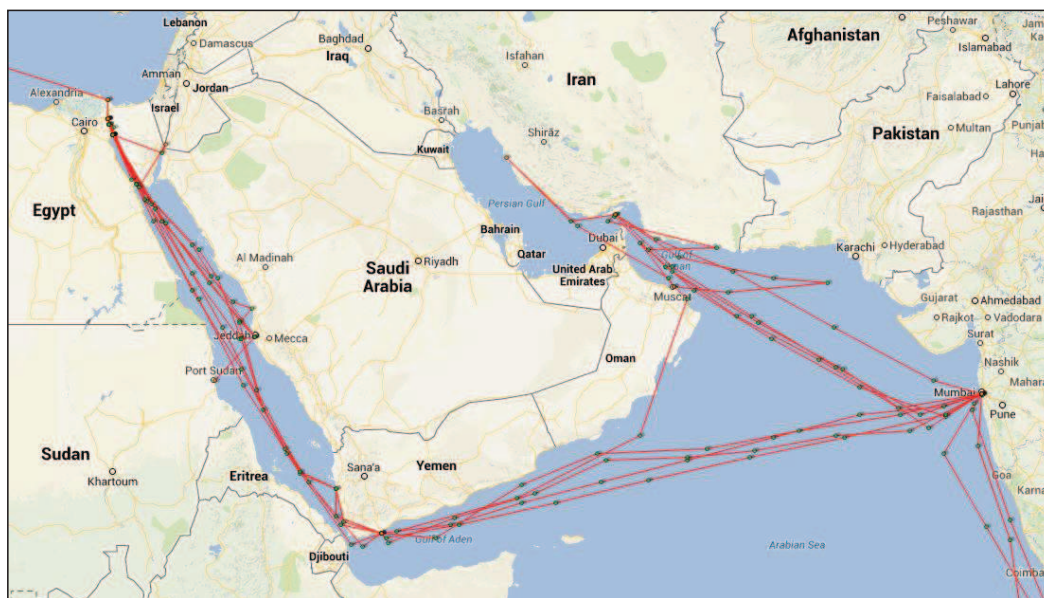
3. ábra: Áden kikötő fontosa a kereskedelmi életben és a világi kapcsolatban

A 3. ábrán szemléltetni kívánom a világ különböző pontjain található szabadkereskedelmi területek sikereit, hol és milyenek voltak ezek az eredmények vagy nehézségek, sikerrel vagy sikertelenséggel jártak-e a próbálkozások a szabadpiac kiépítését illetően. Áden előtt egyértelmű legyen a választás, a döntés lehetősége.