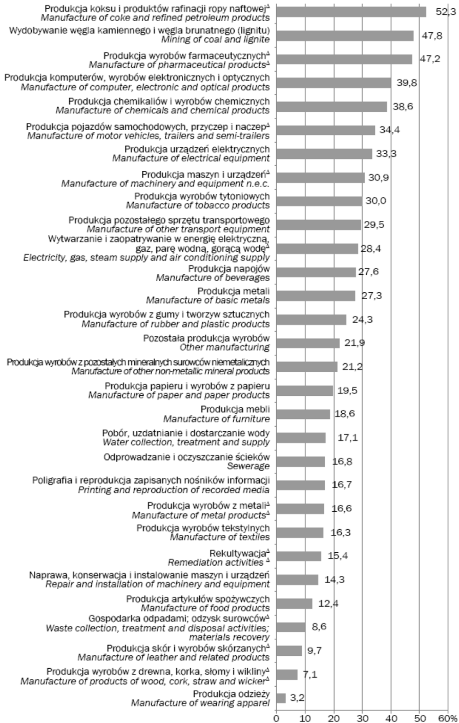
Rysunek 1. Przedsiębiorstwa przemysłowe aktywne innowacyjnie w latach 2010-2012 według działów PKD Figure 1. Industrial innovation active enterprises in the years 2010-2012 by NACE divisions Źródło/Source: [Działalność innowacyjna... 2013]