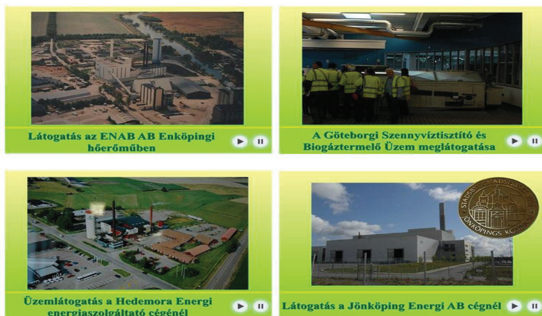
3. ábra: A „Zöld energia a zöld Magyarorszáért” informatív kutatási animációi Forrás: Saját készítésű kép a „Zöld energia a zöld Magyarorszáért” weboldal alapján, saját megfigyelés 2014. július 20.

Az újfajta AdWords, GiffMaps, amelyek egyfajta reklám és média tartalomkezelő alkalmazások és egyéb külső alkalmazások segítségével lehetőség lenne rá, hogy az oldalon belül külön fület, ikonokat, ábrákat létrehozva egyszerűbben navigáljunk az oldalon, vagy felkínálja az opciót a Journal of Central European Green Innovation weboldalhoz való átlépésre, amely a társoldala a „Zöld energiával a zöld Magyarorszáért” weboldalnak.