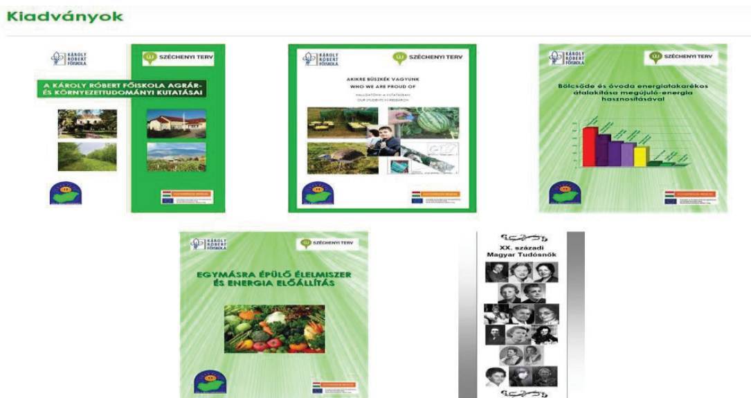
5. ábra: A weboldalról letölthető ingyenes kiadványok

A „Zöld energiával a zöld Magyarországért” weboldal a „Kiadványok” menüpontjában 5 különböző kiadványt találunk. A kiadványok 22-32 oldal terjedelműek, főként tudományos témáról szólnak és a megújuló energiaforrások egyre fokozódó szerepéről magyarországi és nemzetközi szinten. A fájlok ingyenesen letölthetőek PDF formátumban, abban az esetben, ha a számítógépünk rendelkezik az Adobe Reader vagy más PDF olvasó program kiterjesztéssel. Ebben az esetben könnyen le tudjuk menteni a kiadványokat, de amennyiben nincs fent ez a kiegészítőnk, nem tudjuk lementeni a folyóiratokat. Ezzel kapcsolatos javaslatunk az volt, hogy a külön letöltési opcióra azért van szükség, hogy az Adobe Reader program hiánya esetén is le tudja menteni a felhasználó a kiadványokat.