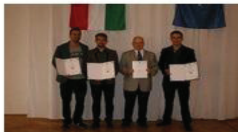
6. ábra: Az első Európai Unió verseny életképei, amely elérhető a „Zöld energiával a zöld Magyarországért” weboldalon