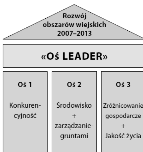
Rys. 2. Program Rozwoju Obszarów Wiejskich i jego osie

związanych z wymaganiami WPR. Spośród narzędzi tej osi, z punktu widzenia poprawy jakości zasobów ludzkich polskiej wsi, szczególnie istotnymi wydawały się działania „Szkolenia zawodowe dla osób zatrudnionych w rolnictwie i leśnictwie” oraz „Korzystanie z usług doradczych”, a także „Renty strukturalne”. Tymczasem, chociaż ich założenia programowe oceniane są jako właściwe [Ocena średniookresowa... 2010], to stan ich wdrażania i praktycznej realizacji uznaje się za niewystarczający. Ma to związek między innymi z późnym uruchomieniem środków na realizację tych narzędzi (jak w przypadku szkoleń zawodowych dla osób zatrudnionych w rolnictwie i leśnictwie), lub z ich niedoszacowaniem (renty strukturalne), ale też z brakiem zainteresowania ze strony beneficjentów (korzystanie z usług doradczych).