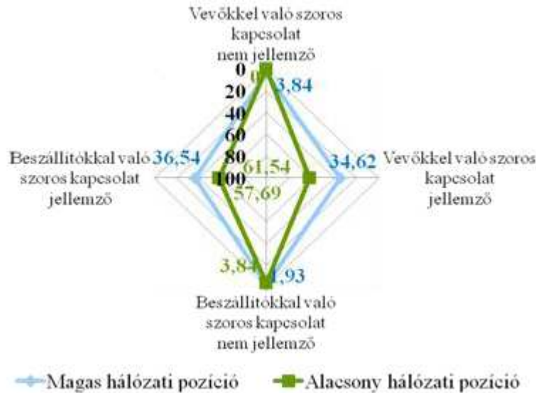
1. ábra: A vevői és beszállítói kapcsolat szorossága és az észlelt hálózati pozíció közötti összefüggés