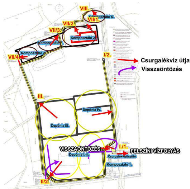
1. ábra: Csurgalékvíz-elvezető rendszer sematikus ábrája

ezáltal következtettünk az egyes csurgalékvíz gyűjtő alegységekben keletkező csurgalékvíz mennyiségére.