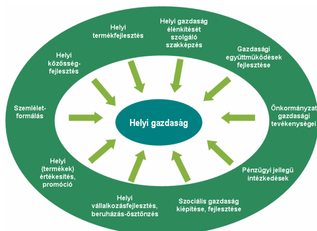
2. ábra: A helyi gazdaság fejlesztésének kapcsolatrendszere

hogy azok működése optimális legyen az adott gazdasági, társadalmi viszonyok és feltételek között. Az irányzat elméleti gyökerei a generatív növekedési koncepcióban rejlenek, amiben az fogalmazódik meg, hogy a lokális fejlődési teljesítményekből, azok fejlődési kapacitásaiából levezethető, sőt generálható a nagyobb területi egység növekedése, így a komparatív lokális előnyökre épülő gazdaságfejlesztés összessége adhatja meg az alapot a regionális fejlesztésekhez.