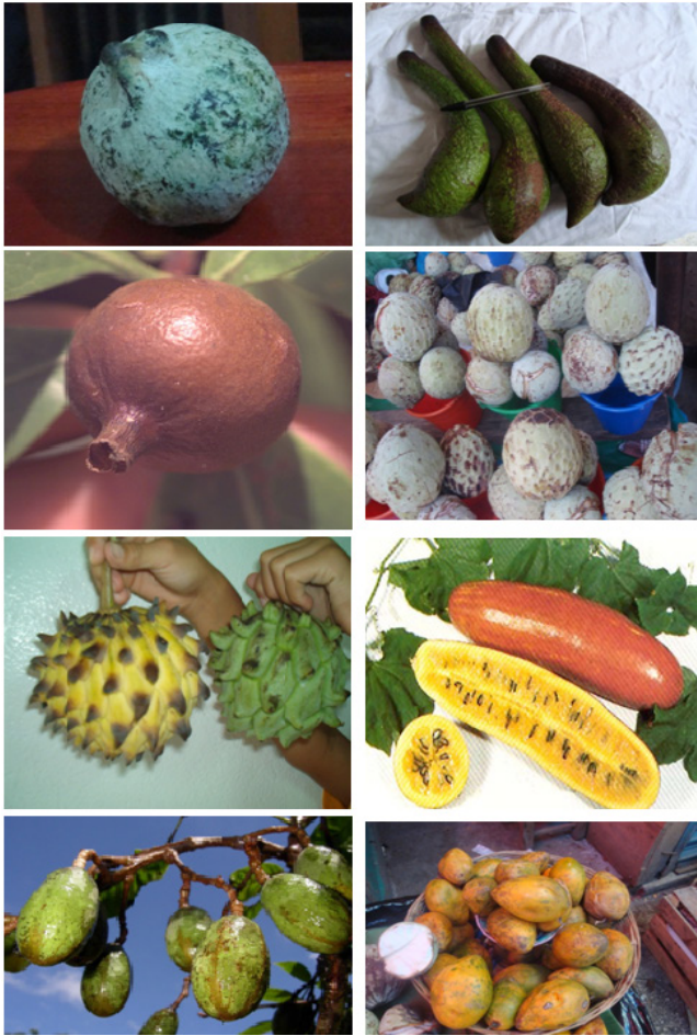
Figura 1. Especie con potencial del sur de México. Salacia elliptica (Mart.) G. Don (Gogo), Persea schieddeana Nees (Chinin), Alibertia edulis A. Rich, (Castarrica), ( Annona diversifolia Saff), biribá ( Rollinia mucosa (Jacq) Bail ), melocoton ( Sicana odorifera Vell), jobo cimarron ( Spondias radlkoferi J. D. Smith (jobo cimarron), ( Pouteria campechiana (HBK.) Baehni (Kanisté).

Por otra parte, el efecto general estimado del cambio climático provocado por el hombre muestra que el hábitat de muchas especies se desplazará hacia los polos, o hacia altitudes mayores respecto a sus emplazamientos actuales Lorente et al., (2004); Sachs, (2010).