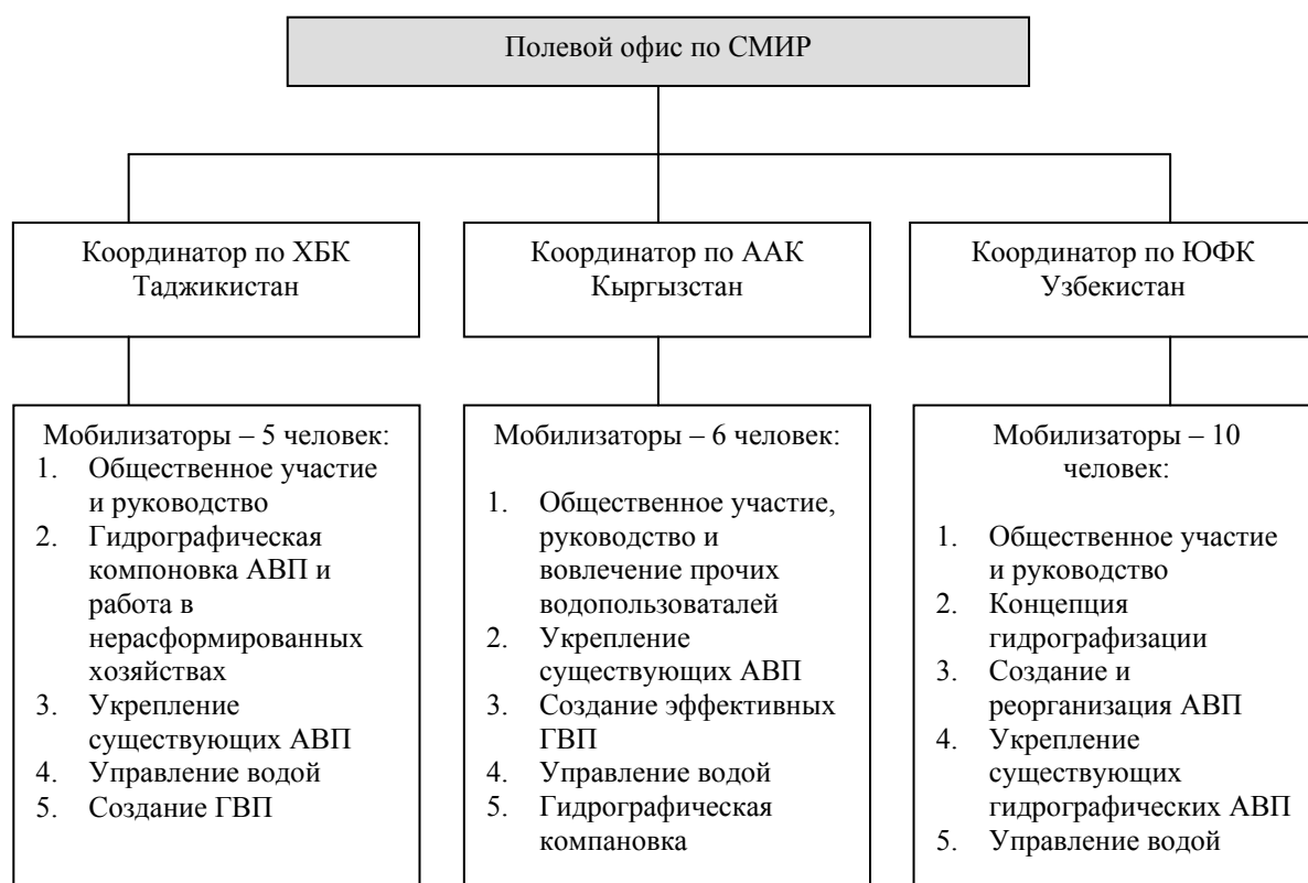
Рис 4.26. Стратегия СМИР и организационная структура полевой деятельности

В начале каждого года, работники проекта выезжали и консультировались с заинтересованными сторонами по вопросам правильной, эффективной и интенсивной организации СМИР на каждом пилотном канале. Все рекомендации и предложения записывались. На основе анализа поступивших предложений по улучшению работ и задач проекта разрабатывалась стратегия осуществления работ по СМИР применительно к каждому каналу. По результатам разработки в каждой стране с командой по СМИР проводился рабочий семинар, где каждый консультант имел возможность выступить и высказывать мнения по поводу предлагаемой стратегии, т.к. полевой и практический опыт мобилизаторов был всегда полезен в выработке планов работ. На основе уточненных и скорректированных в результате обсуждений генерального плана, каждый член команды СМИР разрабатывал индивидуальный план работ, который в течение года служил инструментом для мониторинга и оценки продвижения работ и деятельности команды.