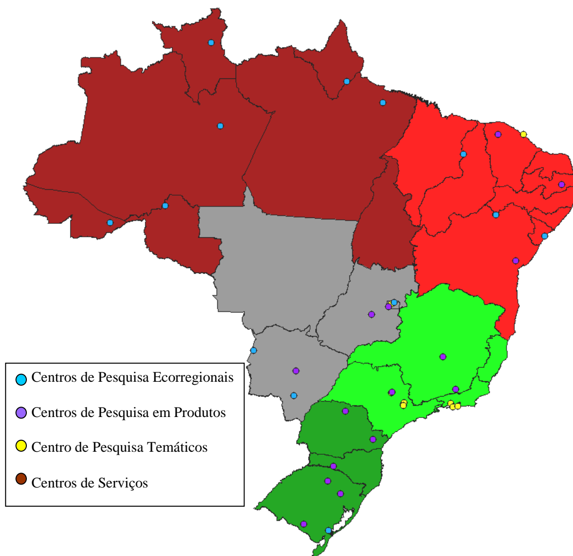
Figura 1: Mapa da Distribuição das Unidades Descentralizadas – UD's da Embrapa pelo território brasileiro.

No que se refere à avaliação de impactos na Embrapa, destaca-se por dois pontos. Primeiramente, o exercício de avaliar os impactos foi institucionalizado em todas as Unidades da Empresa, como um dos critérios do Sistema de Avaliação de Desempenho de Unidades (SAU), tornando-se um processo permanente. O segundo ponto se refere à mudança de foco das avaliações de impactos realizadas na Embrapa: de unidimensional para multidimensional, o que implicou na incorporação de outras dimensões: social e ambiental, além da análise dos outros impactos (capacitação, avanço do conhecimento e político-institucionais).