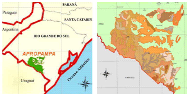
Figura 3: Limites da área de produção do “Pampa Gaúcho da Campanha Meridional”

delimitada em função da caracterização botânica 17 dos campos destes municípios, chamados de Campos finos, do tipo e uso de solo. O cruzamento destes três fatores delimitou a área de produção do “Pampa Gaúcho da Campanha Meridional” perfazendo uma área total de 12.935 Km 2 localizada integralmente na Metade Sul do estado do RS, conforme o mapa representado na figura a seguir: