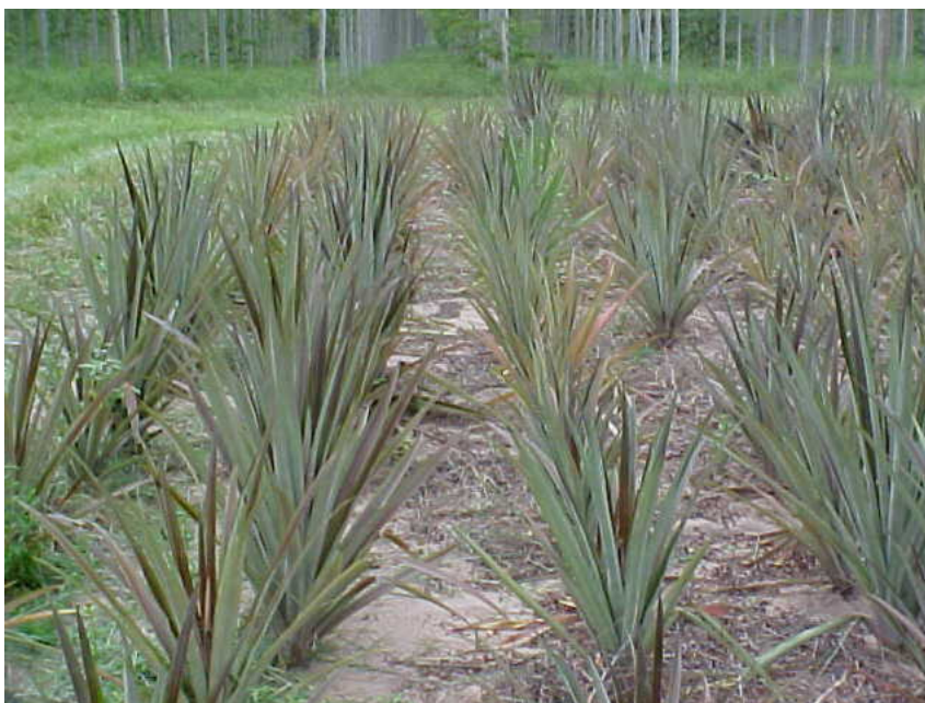
FIGURA 1 – Aspecto de Plantio de Curauá a pleno sol.

A espécie Ananas comosus var. erectifolius (L. B. Smith) Coppens & Leal (curauá) (Figura 1) conforme a descrição de Medina (1959) é uma planta fibrosa, monocotiledônea, terrestre herbácea, de sistema radicular fasciculado, superficial, pouco exigente e que se adapta a diferentes tipos de solo e a mudanças climáticas. Pertencente à Família Bromeliaceae e ao Gênero Ananas e ocorre nos Estados do Pará, Acre, Mato Grosso, Goiás, Amapá e Amazonas (LEDO, 1967). Há dois tipos distintos de curauá: um de folhas verde-claro, chamado de curauá branco e outro de folhas roxo-avermelhadas, conhecido como curauá roxo (LÊDO, 1967). Apresentam folhas eretas, coriáceas, medindo cerca de 5 cm de largura, 5 mm de espessura, aproximadamente 1,5 m de comprimento.