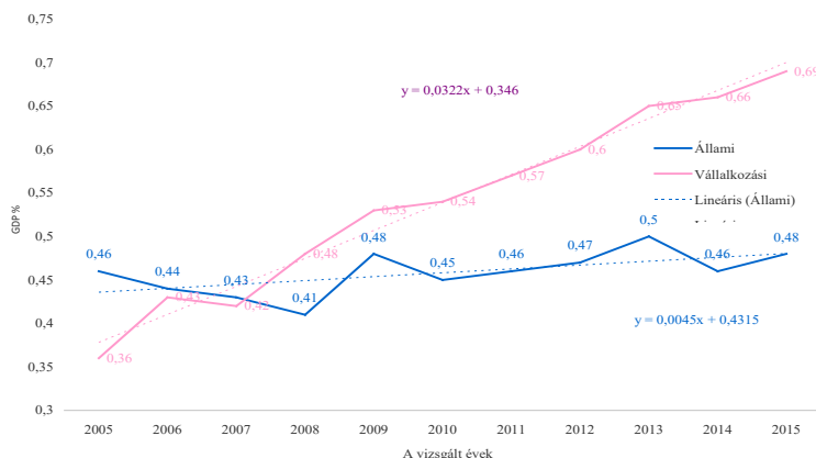
3. ábra: K + F ráfordítások a GDP százalékában az állami és a vállalkozási szektorban