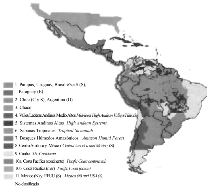
Figure 2. Megadomanins for FONTAGRO.