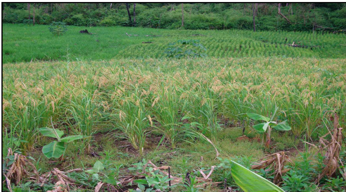
Figura 3 - Plantio de banana comprida (D'Angola) consorciada com arroz no município de Acrelândia.