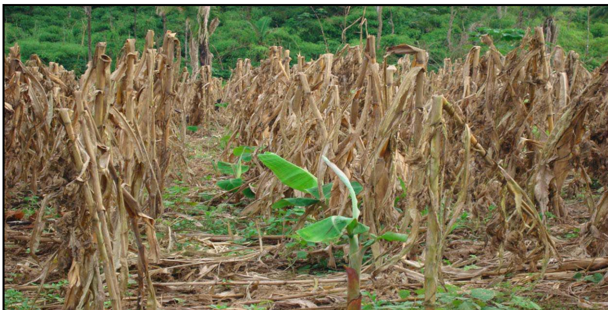
Figura 2 - Plantio de banana comprida (D'Angola) consorciada com milho no município de Acrelândia.