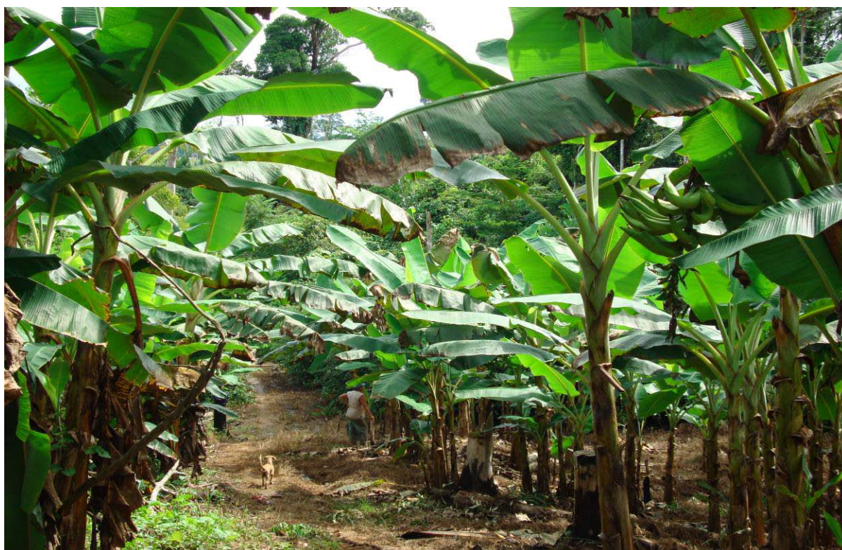
Figura 4 - Área de banana comprida (D'Angola) em produção no município de Acrelândia-AC.

capina química com o uso de herbicidas, as desfolhas e, no segundo ano, a adubação verde com puerária ( Pueraria phaseoloides ), cuja principal finalidade é deixar a área em pousio por um período de 2 a 3 anos, para posterior utilização, ou servir de adubação para a pastagem implantada no fim do ciclo da banana. A prática do desbaste não é utilizada. A atividade é desenvolvida basicamente por agricultores familiares sendo a gestão da propriedade exercida diretamente pelo produtor e família. A figura 4, mostra uma área de banana comprida em produção, localizada no Projeto de Assentamento Orion, no município de Acrelândia.