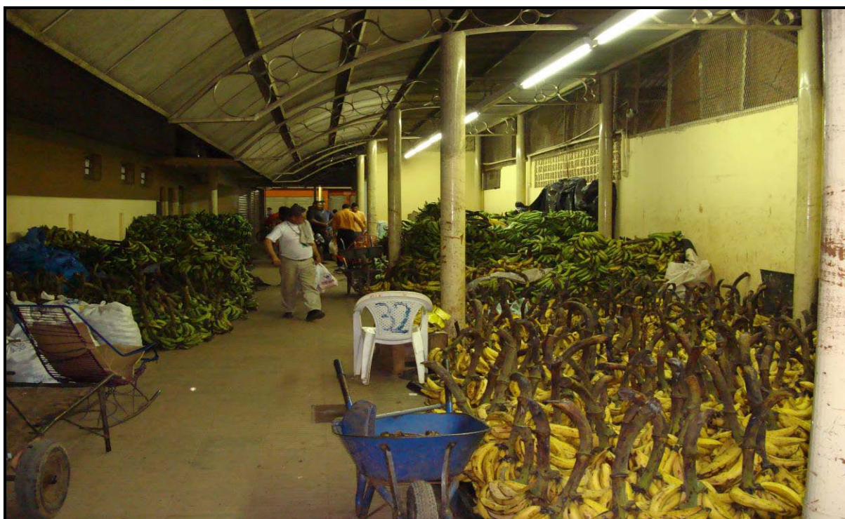
Figura 5 - Principal ponto de distribuição de banana comprida (D'Angola) em Rio Branco-AC.

transportada de caminhão, ou de trator, se a distância for pequena, até a sede do município de Acrelândia. De Acrelândia, após completada a carga, o transporte é feito por carretas com capacidade média de 30 toneladas, com destino a balsa no Rio Madeira. O transporte de balsa até Manaus dura em média 4 a 5 dias.