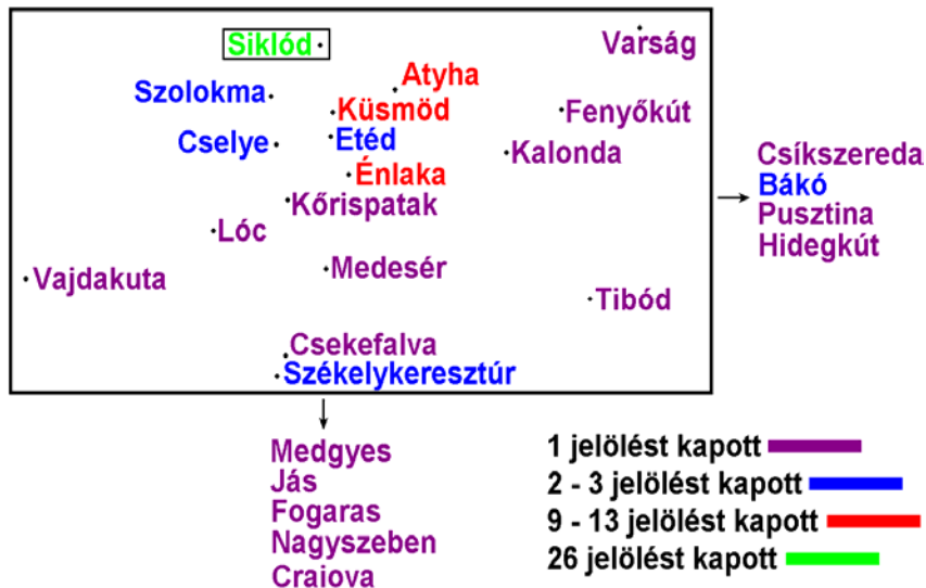
1. ábra : Kedvező helyzetűnek ítélt települések