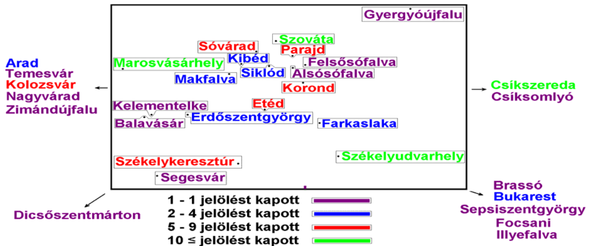
2. ábra : Hátrányos helyzetűnek ítélt települések

A kérdőívekből kiszűrhető legfontosabb elvándorlást generáló tényezők Siklód életében az alábbiak: