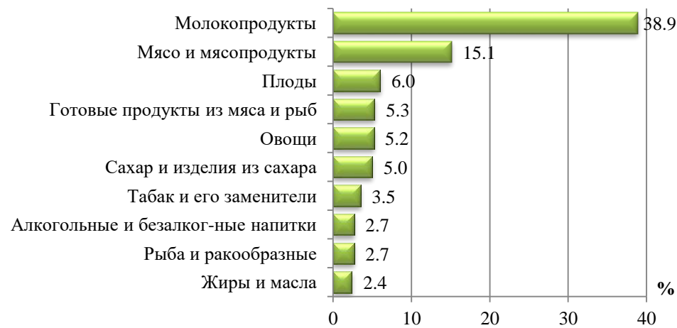
Структура экспорта сельскохозяйственного сырья и продовольствия Беларуси в 2015 г., %