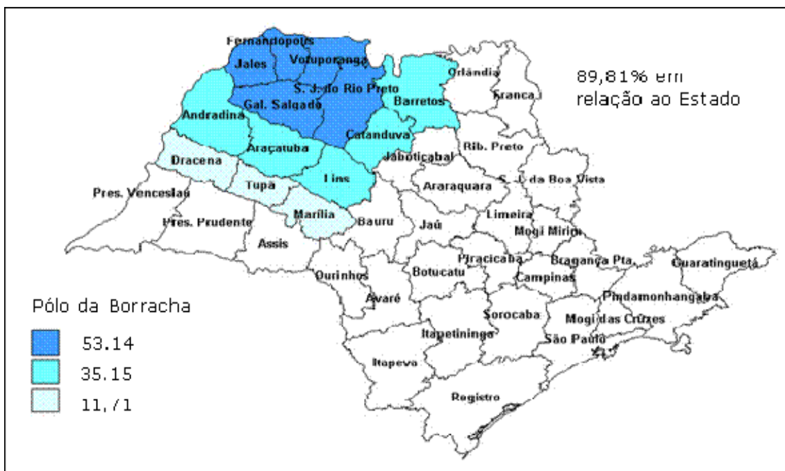
.Figura 1 – Pólo de Produção da Borracha no Estado de São Paulo